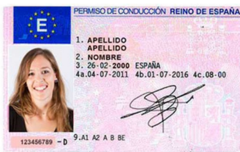
Carné de conducir