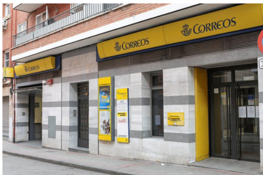
Esta é unha imaxe dunha oficina de Correos

O último día para presentar esta solicitude é o 8 de febreiro de 2024.